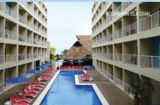
DECAMERON ISLA CORAL