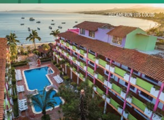
DECAMERON LOS COCOS