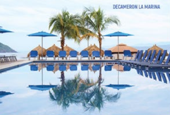
DECAMERON LA MARINA